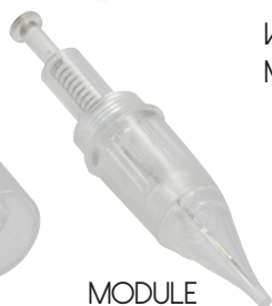
MODULE MAQUILLAGE PERMANENT